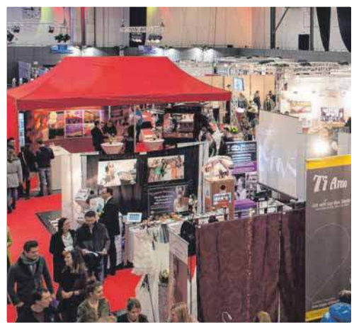
Auf der Hochzeitsmesse „Ewig Dein“ finden Sie alles für den schönsten Tag im Leben.